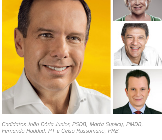
Candidatos João Dória Junior, PSDB, Marta Suplicy, PMDB, Fernando Haddad, PT e Celso Russomano, PRB.