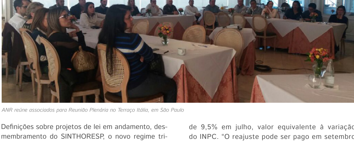
ANR reúne associados para Reunião Plenária no Terraço Itália, em São Paulo

Definições sobre projetos de lei em andamento, desmembramento do SINTHORESP, o novo regime tributário do Rio de Janeiro e as altas taxas cobradas pelos aplicativos de delivery foram alguns dos principais temas abordados na Plenária da ANR , realizada na última quinta-feira (25), no Terraço Itália.