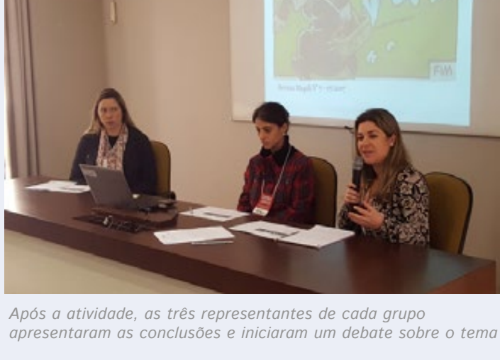
Após a atividade, as três representantes de cada grupo apresentaram as conclusões e iniciaram um debate sobre o tema