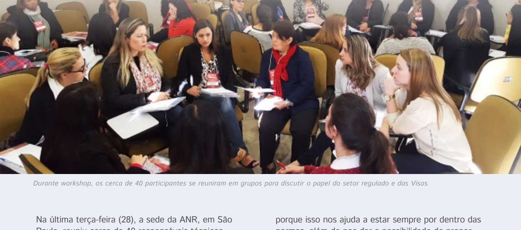
Durante workshop, os cerca de 40 participantes se reuniram em grupos para discutir o papel do setor regulado e das Visas

Na última terça-feira (28), a sede da ANR, em São Paulo, reuniu cerca de 40 responsáveis técnicos para um encontro inédito com representantes das Visas de Santo André, São Bernardo e Osasco. Com o objetivo de promover debates sobre o segmento e, principalmente, a troca de experiências, o evento começou com uma provocação da Vigilância de Santo André aos participantes.