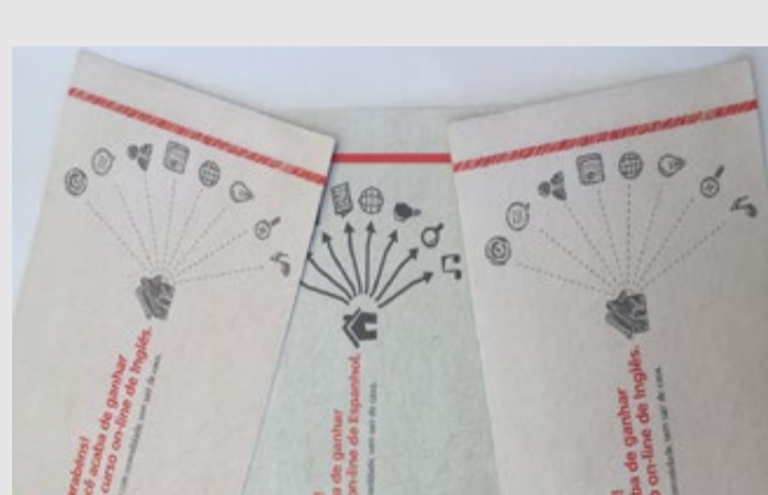
Modelo de voucher para utilização das bolsas de estudo