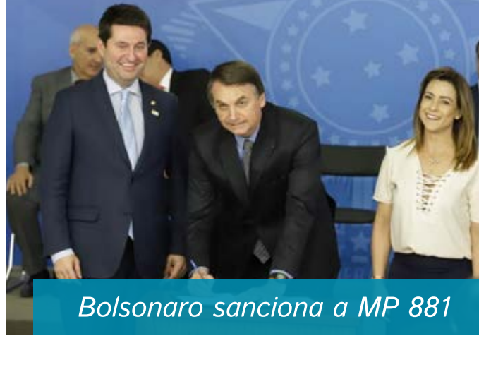
Bolsonaro sanciona a MP 881