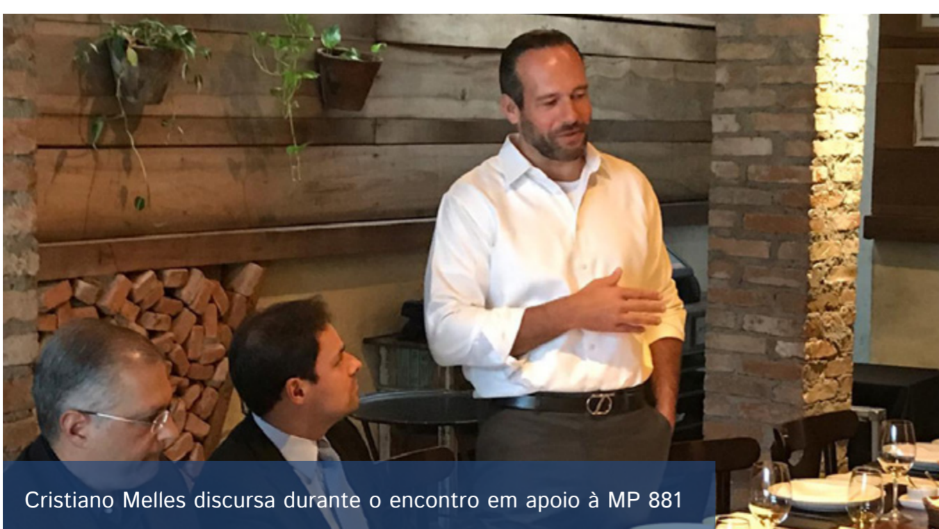
Cristiano Melles discursando durante o encontro em apoio à MP 881